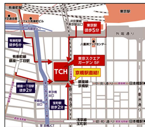
「東京駅」八重洲南口徒歩5分 地下鉄「京橋駅」3番出口直結

対象者：事業者（RE100、CDP、SBT、SDGs に関心をお持ちの方、CO2削減の取組 みをお考えの方）、行政、産業支援機 関担当者 等